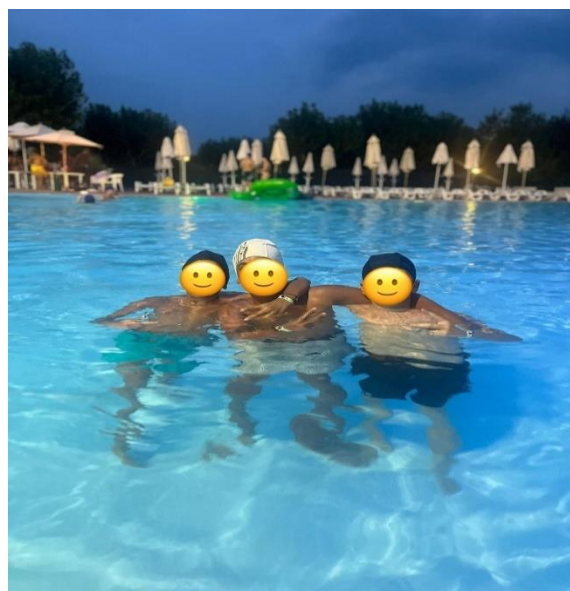
... In Piscina ...