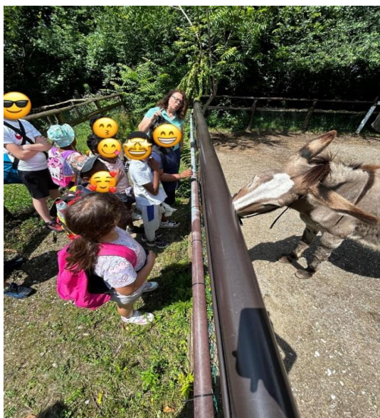
... Al Parco Natura Viva ...