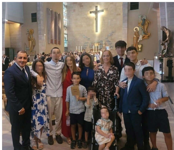
Abbiamo avuto la gioia di ospitare all' Oasi una bellissima e numerosa famiglia dalla Spagna