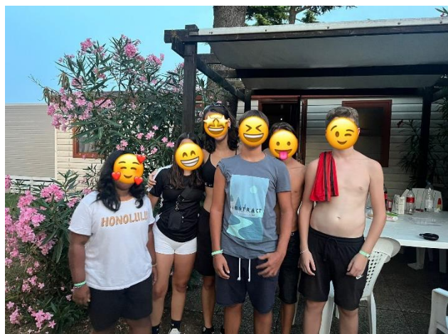
... una settimana in campeggio sul Lago di Garda...