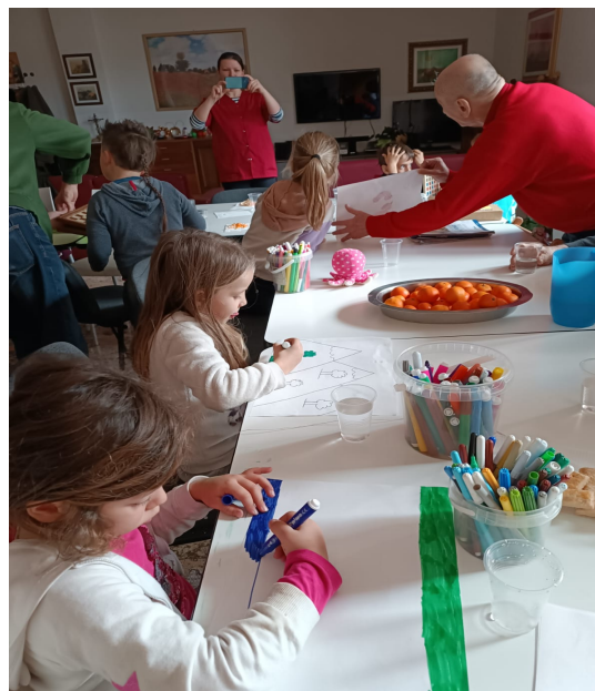
Anche quest' anno i bambini della scuola parentale "Un Villaggio per Crescere" torneranno all' Oasi per le loro attività con i nonni della Casa Accoglienza