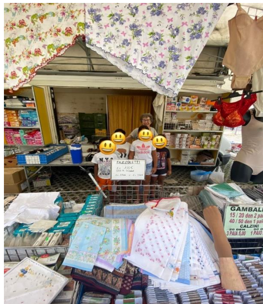
...Al mercato del Saval...