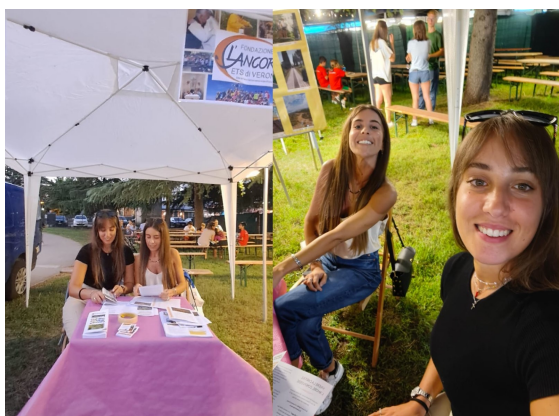
Abbiamo partecipato alla sagra di Settimo di Pescantina per far conoscere le nostre realtà